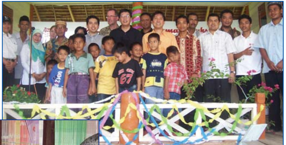
Invigningsceremoni i Cot Suruy

Trade Union Care Center Foundation (som sponsras av UNI-Asia Pacific och SASK Finland) planerar att bygga ett tredje samhällscenter för tsunamidrabbade västra Aceh. Två center är redan uppe och fungerar i Calang och Cot Suruy (med bland annat datakurser för indonesiska kursledare). Meulaboh-distriktet var bland de områden som drabbades värst av flodvågen 2004. Syftet med dessa samhällscenter är att ge utbildning och yrkesutbildning åt barn och vuxna i sex byar. (uni-asiapacific@uniglobalunion.org)