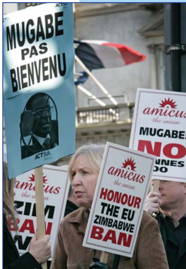
Amicus protester "No Cannes do" utanför franska ambassaden i London mot att inbjuda Zimbabwes President Robert Mugabe till ett toppmöte

Ett beslut av Högsta Domstolen i Korea har undanröjt alla hinder för migrerande arbetare - oavsett deras status - att gå med i och bilda fackliga organisationer. Detta innebär att även arbetare utan arbetstillstånd kan organisera sig fackligt. Migrant Forum i Asien välkomnar beslutet. Regeringen väntas nu ta upp fallet vid den Högsta Domstolen. (uni-asiapacific@uniglobalunion.org)