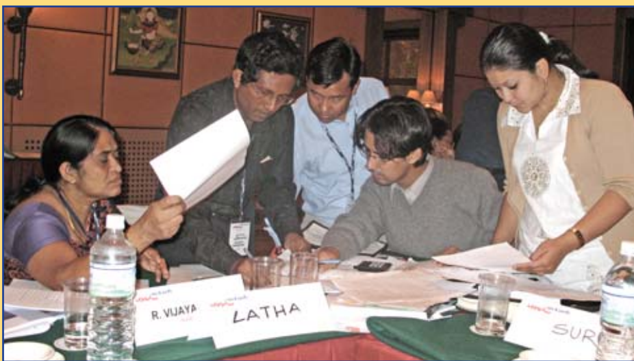
Workshop i Nepal