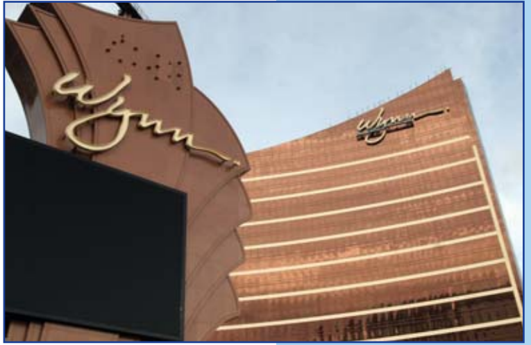
Det amerikanska kasinot Wynn är redan etablerat i Macau

UNI Spel kommer att sammanträda i juli i Macau - världens största spelstad. UNIs spelsektor i Asien och Stillhavsområdet kommer att tilldra sig deltagare från hela världen. Mötet sammanfaller med den asiatiska spelbranschmässan i Macau som är en särskild administrativ region inom folkrepubliken Kina. Ungefär hälften av arbetstagarna i Macau jobbar inom spelbranschen och UNI planerar att genomföra ett organiseringsprojekt där med hjälp av UNIs utvecklingskontor i Hongkong. (alke.boessiger@uniglobalunion.org)