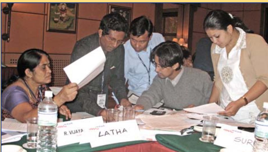
Activo taller en Nepal