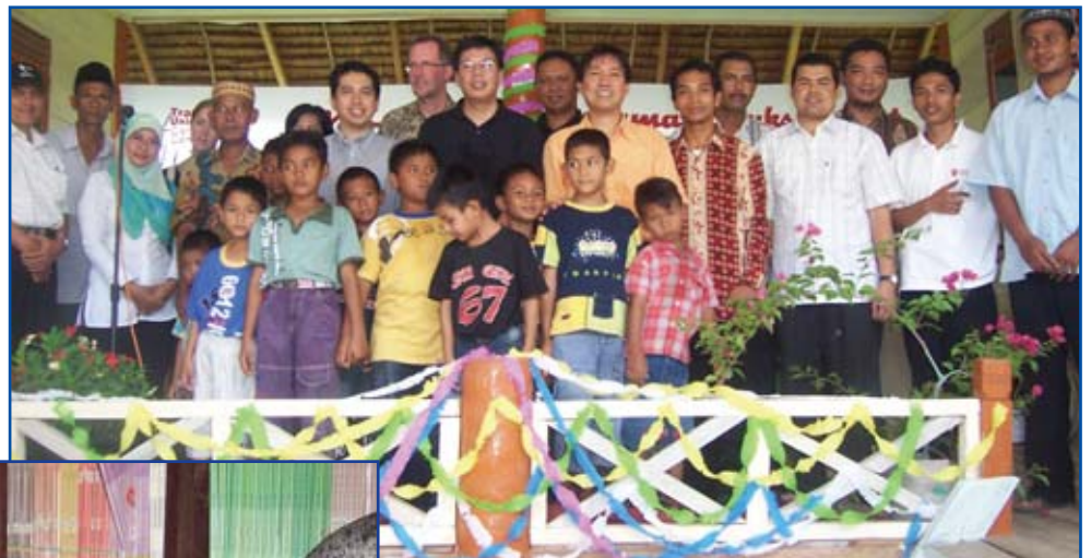
Ceremonia de inauguración en el centro de Cot Suruy

La Trade Union Care Center Foundation (apoyada por UNI-Asia Pacífico y SASK de Finlandia) planea construir un tercer centro comunitario en Aceh Occidental, región afectada por el tsunami. Ya hay centros en funcionamiento en Calang y Cot Suruy (donde recientemente se facilitó formación en informática para formadores indonesios). El distrito Meulaboh fue una de las áreas más afectadas por el tsunami de 2004. La meta es utilizar el nuevo centro comunitario como centro de educación y formación para niños y adultos de seis pueblos. (uni-asiapacific@uniglobalunion.org)