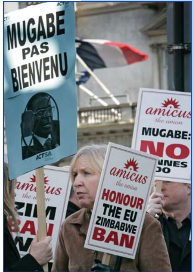
Protesta de Amicus ante la Embajada de Francia en Londres contra la invitación al Presidente de Zimbabwe Robert Mugabe a una cumbre francófona

UNI y sus afiliadas instaron al Presidente francés a que no se invitase al Presidente Mugabe de Zimbabwe a la cumbre Franco-Africana que se celebrará en Cannes los 15 y 16 de febrero. Se exhorta al gobierno francés a que apoye a la comunidad global en su condena del régimen Mugabe por oprimir a sus ciudadanos y denegar los derechos humanos. (neil.anderson@uniglobalunion.org)