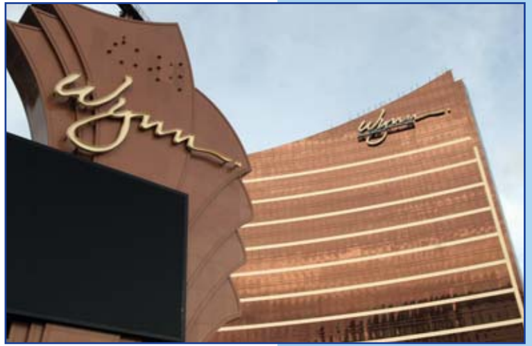
Wynn, operador de casinos estadounidense, ya está establecido en Macao