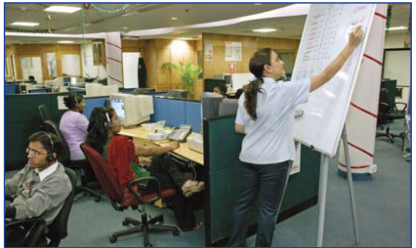
Mise à jour du tableau d'objectifs au centre d'appel de Transworks, Mumbai, Inde