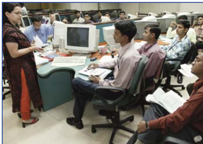
Formation des nouvelles recrues: Infowavz Mumbai, Inde