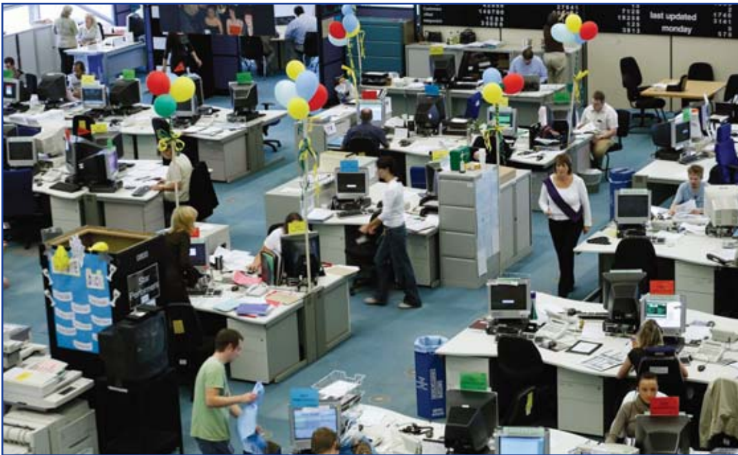
Services bancaires par téléphone: First Direct, Leeds, Royaume-Uni